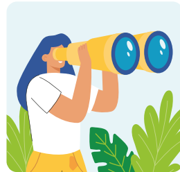
Toujours être derrière