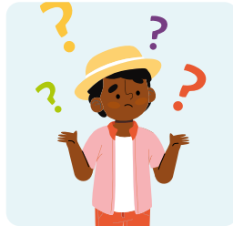
Manque d'autonomie à la maison