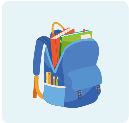
Oublie ses affaires

Cog-Fun™ est indiquée lorsque la qualité de vie est impactée par le TDAH :