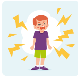
Crises de colère