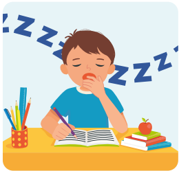
Besoin constant de stimulation