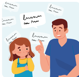
Toujours rappeler la consigne